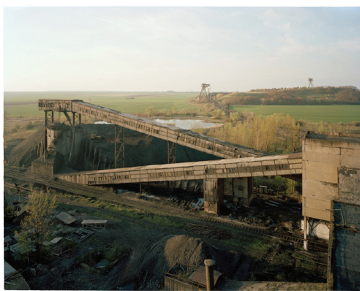
07_ Anatoliy Babiychuk