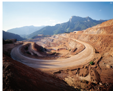
08_ Margherita Spiluttini