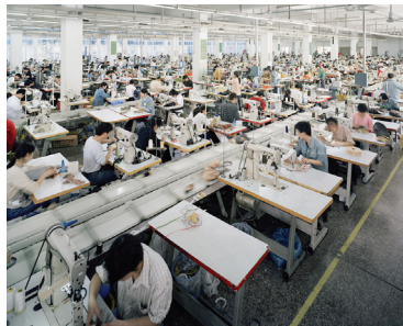
05_ Edward Burtynsky