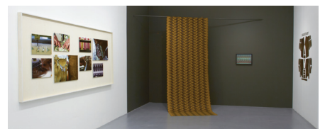
09_ Sascha Reichstein